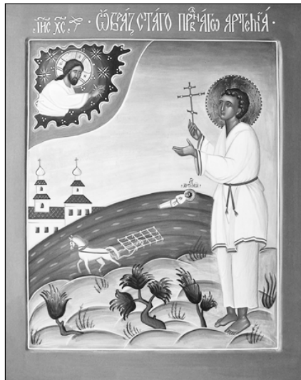
Св. прав. отрок Артемий Веркольский. Сийская иконописная мастерская.

2 ноября — память праведного отрока Артемия Веркольского († 1545 г.)