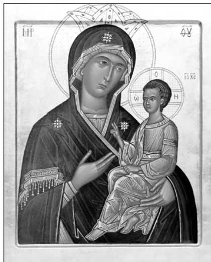
Икона Божией Матери «Скоропослушница». Сийская иконописная мастерская.

22 ноября — иконы Божией Матери, именуемой «Скоропослушница».